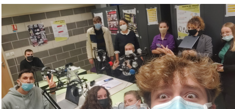
Les germanistes en mode «émission de radio»

Vous assistez également à diverses conférences .