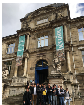
Une sortie au Musée des Beaux Arts